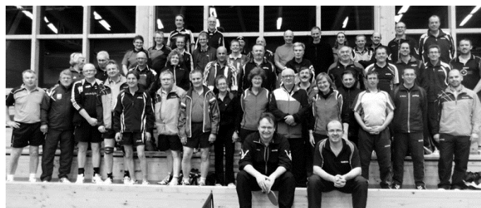
Gesamtbild mit allen Seniorinnen und Senioren