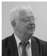
Karl Traub, MdL

27 Mitglieder des CDU Gemeindeverbandes Ulmer Alb (größere können die Besuchergruppen derzeit nicht sein) folgten der Einladung von Karl Traub, MdL, zu einem Besuch in Stuttgart. Karl Traub ist der im Wahlkreis 65 direkt gewählte CDU Abgeordnete im Landtag. Er ist Vorsitzender des Ausschusses Ländlicher Raum und Landwirtschaft. Seit 1996 ist Karl Traub Mitglied des Landtages, 2011 eröffnete er die 15. Wahlperiode des Landtags als Alterspräsident.