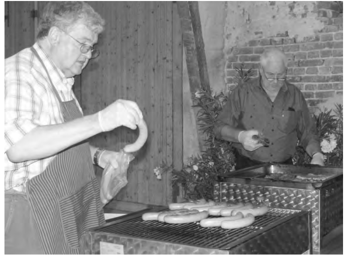
Die beiden Grillmeister in Aktion

worfen und jeder konnte sich entscheiden, ob er zu den leckeren Salaten eine gegrillte Rote bei den Schwarzen oder ein Steak essen wollte. Gekühlte Getränke standen ebenfalls bereit,