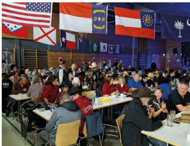
Volles Haus in der Lindenerghalle bei der Alb Country Night

Samstagabend, Lindenerghalle in Beimerstetten, volles Haus und coole Musik – Die Band Saddle `n Boots zauberte Country Songs auf die Bühne, die die über 150 Gäste in ihren Bann zogen und auf die Tanzfläche lockten. Einzelnen, paarweise oder in Formationen der zahlreichen Line Dance Clubs tanzten und feierten unsere Gäste in Cowboy-Stiefeln und mit Westernhut. Versorgt durch die Getränkebar und die Küche des Schützenvereins hielten die Gäste bis Mitternacht durch.