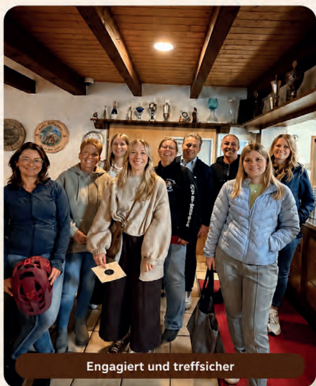
Engagiert und treffsicher

Rathaus team beim Jedermannschießen des Schützenvereins